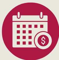
Planes de Pago