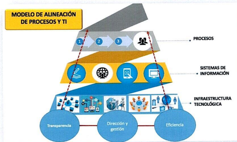
Figura. 3. Modelo de alineación de procesos y TI