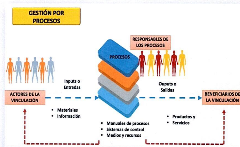
Figura. 2. Modelo de gestión por procesos

Visto así, la Universidad se reconoce como un sistema abierto en el que las unidades que lo componen pierden protagonismo frente a los procesos que les permiten interactuar entre sí para alcanzar siempre resultados mejorados y de calidad. Con el propósito de lograr eficiencia y calidad, se ha institucionalizado un modelo de gestión por procesos (Figura 2) que plantea una secuencia objetiva de actividades mutuamente relacionadas, interactuantes; las que están llamadas a transformar elementos de entrada en resultados (productos y servicios) de calidad.